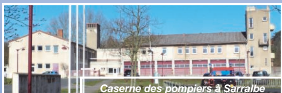
Caserne des pompiers à Sarralbe

Sarralbe, Chef lieu de Canton, mérite de s'équiper d'un bâtiment moderne, fonctionnel et aux normes pour les pompiers, à l'instar d'autres villes.