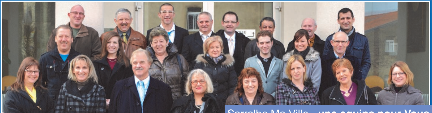
Sarralbe Ma Ville - une équipe pour Vous.

Notre liste, avec des gérants de sociétés, responsables à différents niveaux, ancien artisan, enseignant, des métiers sociaux-éducatifs, met à votre service tout son dynamisme et ses compétences.